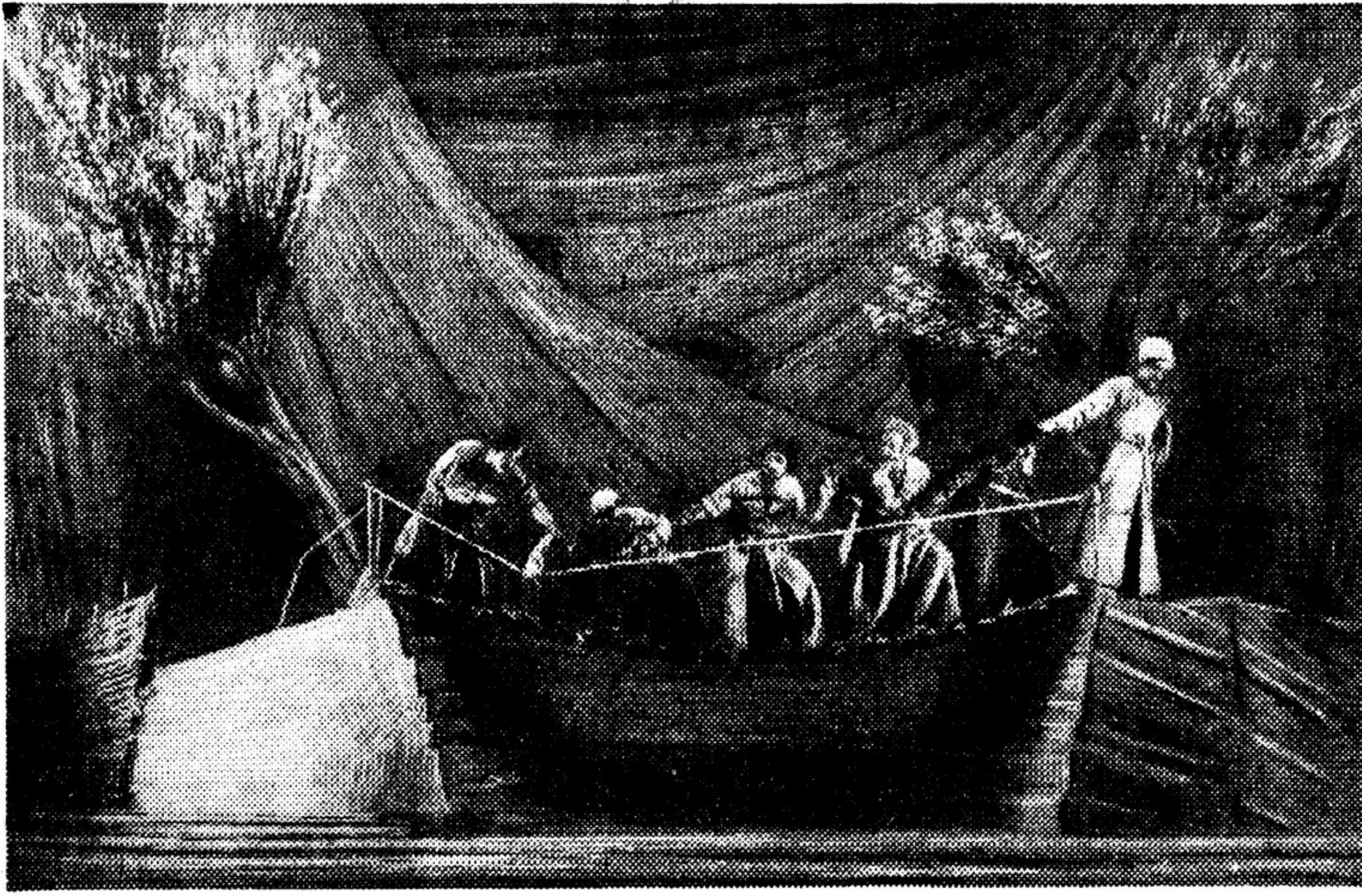
«Беситные дворняги» С. Кляшницкий в Государственном театре Грузии имени Руставели (режиссер — заслуженный деятель искусств К. Патаридзе, художник — Д. Тавадзе, композитор — заслуженный деятель искусств — И. Туксид).